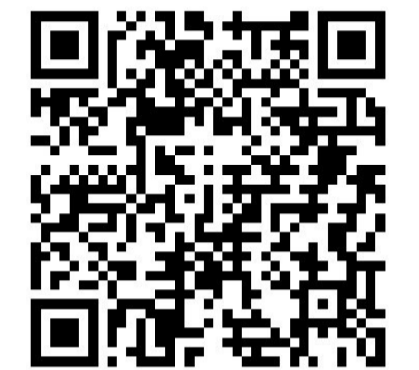
扫描二维码可观看视频